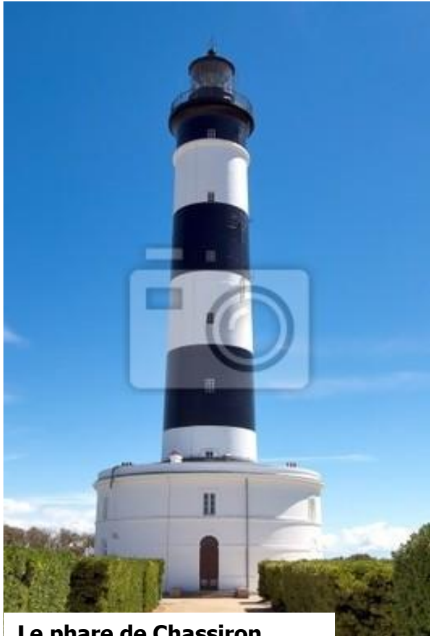
Le phare de Chassiron