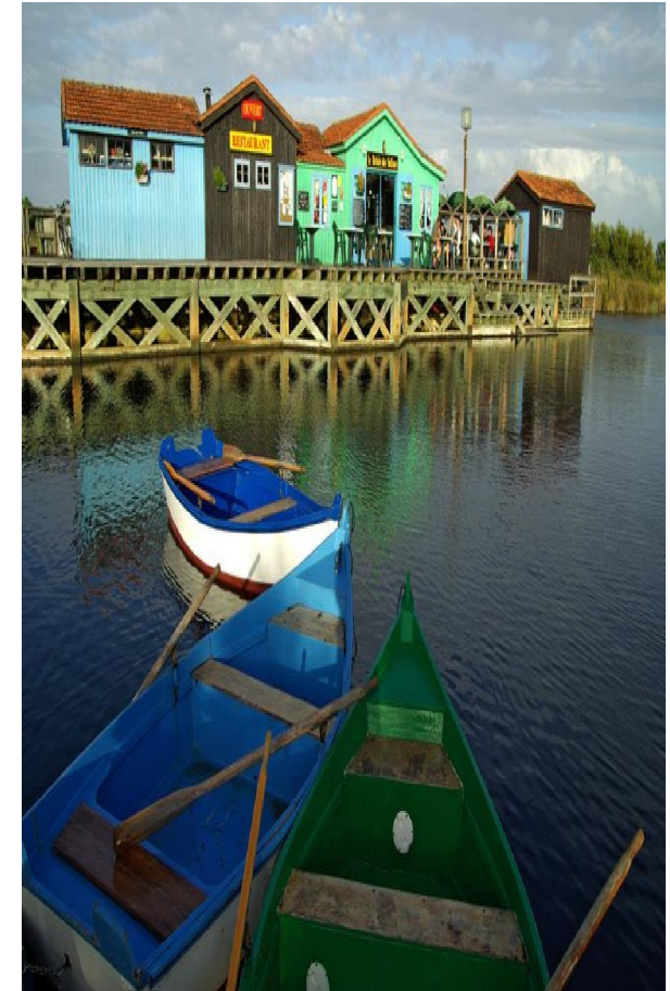
Les petits cabanons de pêche